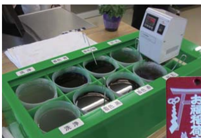
アルマイト処理や染色工程の作業が体験できる