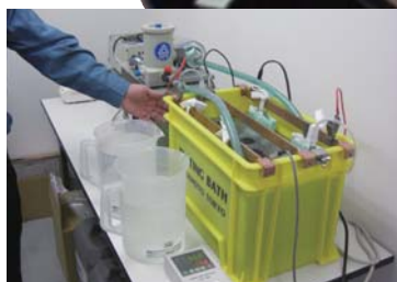
メッキ処理作業体験