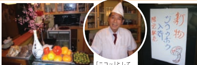
まつたけの横はうし皮 「ニコッ」として みたけど不自然? 名物 手書き看板