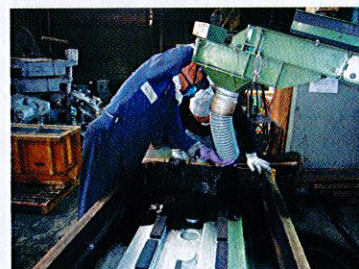
(諏訪および中南信地域でも同種の業態の事業所は数少ない)