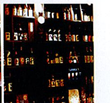
壁一面に並ぶボトルは圧巻。見る人が見れば分かるレアな銘柄もあり！