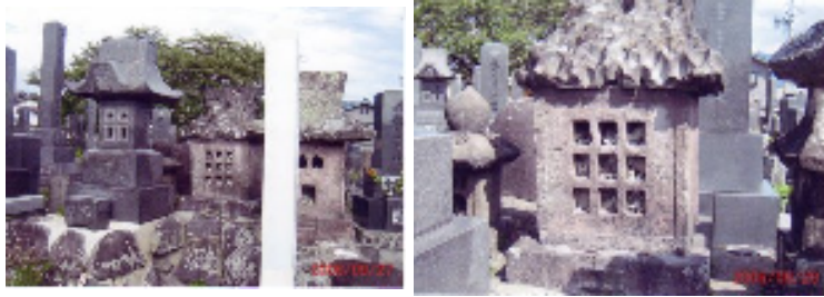
真中が永田徳本のお墓