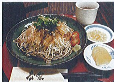
夏の人気 No.1 ぶっかけそば

岳家は、“地元・国産・天然・無添加”素材、そして“お客様の笑顔”をなにより一番大切にしたいと願っています。めでたいハレの食べ物“そば”を笑顔でお楽しみいただけたら、そば屋として最高に幸せです。