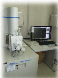
でんしけんびきょう 電子顕微鏡

がっこう 学校にある顕微鏡 けんびきょう とは比べ物になら くらもの ないほど、小さな ちい 物まで観察するこ ものかんさつ とができます！